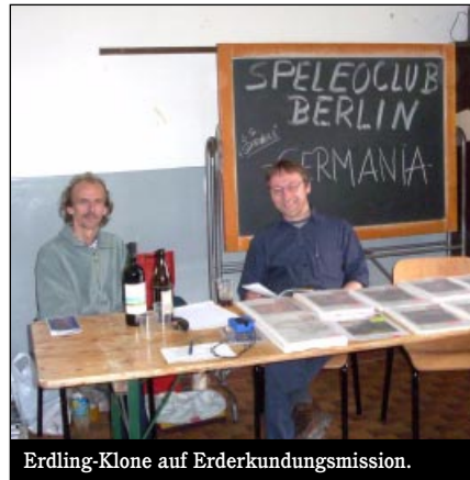
Erdling-Klone auf Erderkundungsmission.

Vor wenigen Stunden erreichte eine Nachricht unseres tapferen Erkundungsteams die Forschungszentrale des Planeten Berlin. Die Nachricht kommt aus dem Quadranten Italien (Sektor Genga) der Milchstraße. Unser Erkundungsteam hat dort unter größter Gefahr für das eigene Leben damit begonnen, das Verhalten der so genannten Erdlinge zu studieren. Dazu wurden in unserem Raumschiff drei Erdlinge geklont, die das genaue Aussehen von aus den Vorjahren bekannten Exemplaren hatten: Ein Weibchen und zwei Männchen.