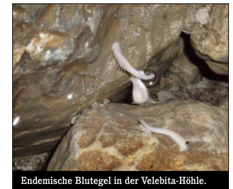
Endemische Blutegel in der Velebita-Höhle.

Im Spätsommer und Herbst wurden neue Tiefenrekorde von Höhlen bzw. Schächten aufgestellt. Eine kroatisch-slowenische Höhlenexpedition hat während einer Forschungstour im August in der Velebita-Höhle (Velebita-Gebirge, Kroatien) den bisher tiefsten zusammenhängenden vertikalen Höhlenschacht gefunden. Nach den Vermessungsergebnissen hat der Schacht eine Tiefe von -513 m. Die größte horizontale Ausdehnung der Höhle beträgt dabei nur 30 m. Eine bemerkenswerte Rarität ist das Vorkommen einer der größten bekannten Kolonien des endemischen stygobionten Blutegels Croathobranthus mestrovi (public.carnet.hr/speleo/velebita).